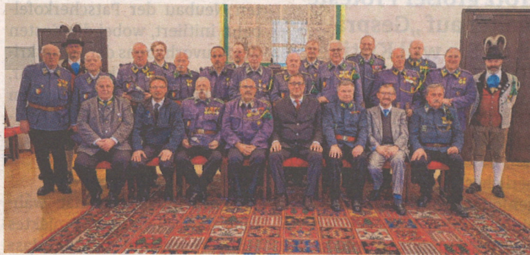
Der Kaiserschützenbund Tirol 1921 bei seiner 96. Generalversammlung im Innsbrucker Rathaus