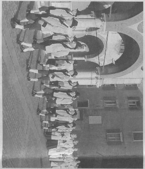
Un momento della processione