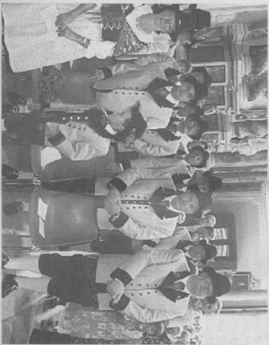
Schützen alle celebrazioni di Maria Ausiliatrice

In questa prospettiva va interpretata la presenza dalla Compagnia Schützen di Rovereto alla cerimonia religiosa per la ricorrenza di Maria Ausiliatrice. I costumi, preziosi e storicamente autentici, vanno visti innanzitutto come segno di profondo rispetto e di convinta partecipazione alla ritualità della cerimonia, ma anche come forte segnale di richiamo e di testimonianza. La tradizione alla quale gli Schützen inten-